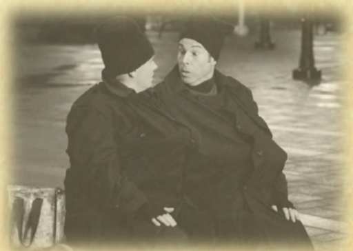
Les deux inséparable